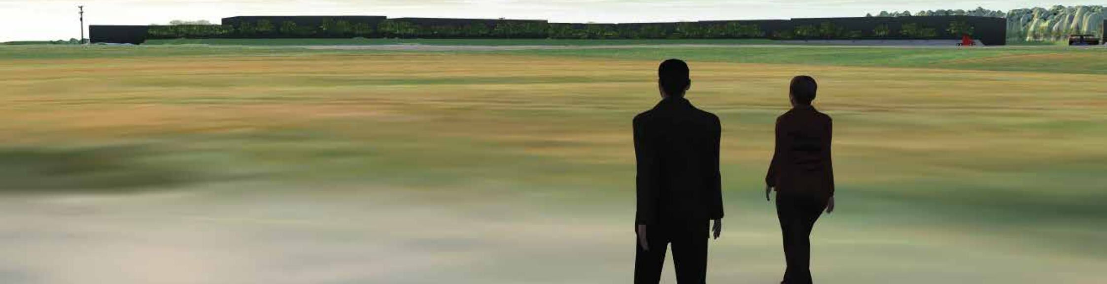
Alternativ 0 - gjeldende regulering