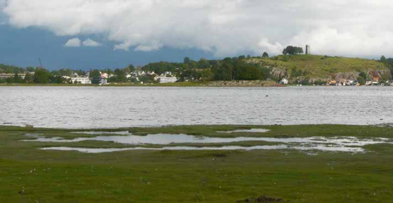
Strandengene ved Ilene, et verneområde utenfor Tønsberg i Vestfold og Telemark, holdes åpne av både storfe og hester. Ilene har vært beitet i århundrer. Svært mange steder i landet skaper beiting grunnlag for naturmangfold.

åker og eng, kantsoner, slåttemark, innmarksbeiter, utmarksbeiter, seterlandskap, dammer, bekker, bygninger, gjerder, steinrøys, driftsveier, m.m. Dette gir et mangfold av levesteder for planter, sopp, insekter, pattedyr og fugler. Mange av artene har få eller ingen alternative leveområder enn det landskapet bonden skaper. Dette gjelder for flere av de bakkehekkende fuglene som holder til i jordbrukslandskapet.