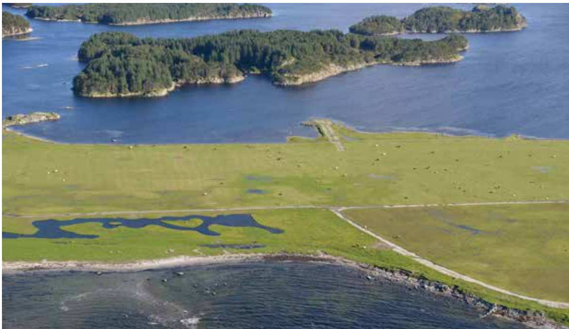
På Herdla, Askøy utenfor Bergen er det etablert fuglevennlige dammer.

næringsstoffer som nitrogen og fosfor, og bidra til karbonlagring og dempe fare for flom og erosjon. I fangdammer er disse naturlige selvrensingsprosessene forsøkt optimalisert. Rensemetsoden i fangdammer er oftest bygget på prinsippet om sedimentering. Uønskede organiske og uorganiske partikler følger bekkevannet inn i renseparken, hvor de blir bunnfall på grunn av tyngdekraften. Åpne dammer med lite skyggende trær og busker gir en langt større mengde insekter enn de som er omkranset av høy vegetasjon, og også klart mer fugleliv. Dermed kan fjerning av vegetasjon rundt eksisterende dammer være et godt tiltak for insekt- og fugleliv i kombinasjon med etablering av nye dammer.