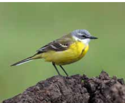
Sørlig gulerle.

i lynghei. Reiret legges i en liten grop i bakken, av og til skjermet av ei grastue, men ofte ganske eksponert. Sanglerka legger 3 – 5 egg som ruges av hunnen i 11 dager, som oftest i mai. Begge foreldre mater ungene, som forlater reiret etter 9 – 10 dager. Begge foreldre mater ungene, som forlater reiret etter 9 – 10 dager. Ungene flyr først ved ca. 20 dagers alder, og fram til da gjemmer de seg ved å «trykke» mot bakken.