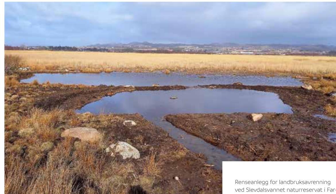
Renseanlegg for landbruksavrenning ved Slevdalsvannet naturreservat i Farsund, Agder. For å fjerne næringsstoffer i vann fra jordbruksarealer før det kommer ut i naturreservatet er det laget en liten fangdam (ca. 100 m 2 ) som fungerer som et sedimenteringskammer. Vannet går så over en overrislingsone og får tilført oksygen og videre ned til en større dam (ca. 530 m 2 ) som fungerer som våtmarksfilter før vannet til slutt renner inn i reservatet. Dammene er laget på en slik måte at de begunstiger fuglelivet i området, hvor det er behov for mer åpent vannspeil som ikke tørker ut i sommermånedene. Erfaringer fra flere smådammer som er opparbeidet i Slevdalsvannet de siste årene er brukt for å lage så optimale dammer som mulig for fuglelivet.

næringsstoffer som nitrogen og fosfor, og bidra til karbonlagring og dempe fare for flom og erosjon. I fangdammer er disse naturlige selvrensingsprosessene forsøkt optimalisert. Rensemetsoden i fangdammer er oftest bygget på prinsippet om sedimentering. Uønskede organiske og uorganiske partikler følger bekkevannet inn i renseparken, hvor de blir bunnfall på grunn av tyngdekraften. Åpne dammer med lite skyggende trær og busker gir en langt større mengde insekter enn de som er omkranset av høy vegetasjon, og også klart mer fugleliv. Dermed kan fjerning av vegetasjon rundt eksisterende dammer være et godt tiltak for insekt- og fugleliv i kombinasjon med etablering av nye dammer.