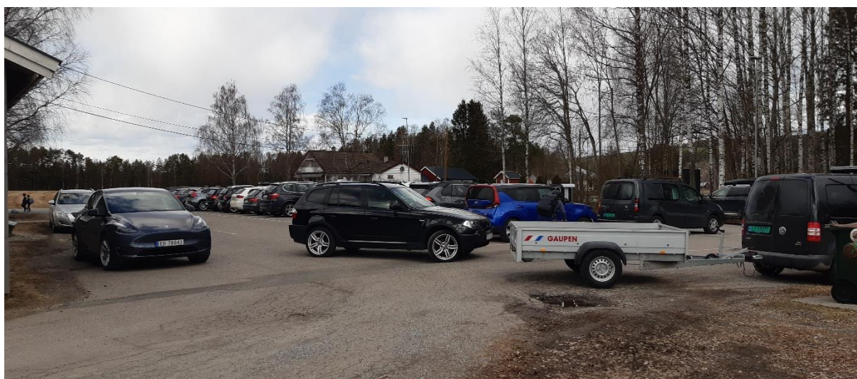
Figur 2: Bilde fra parkeringsplassen.