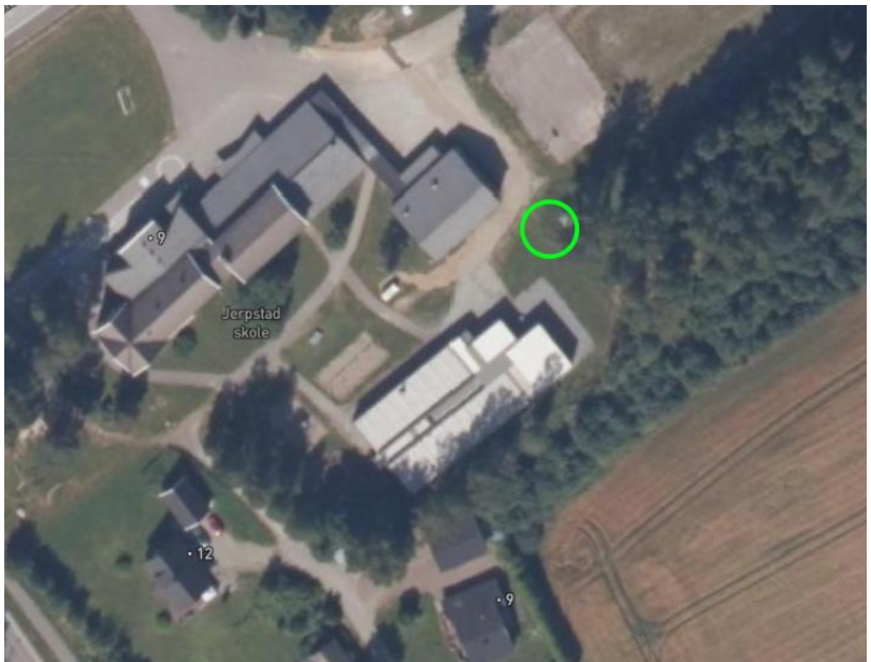
Figur 4: Viser ønsket plassering for akehaug.

Med tanke på alle byggeprosjektene som nå skal gjennomføres ønsker skolen eventuell overskuddsmasse for å bygge opp litt terreng på skoleplassen. Hovedsakelig for bruk som akebakke på vinteren. Bilde under viser ønsket plassering for akebakken.