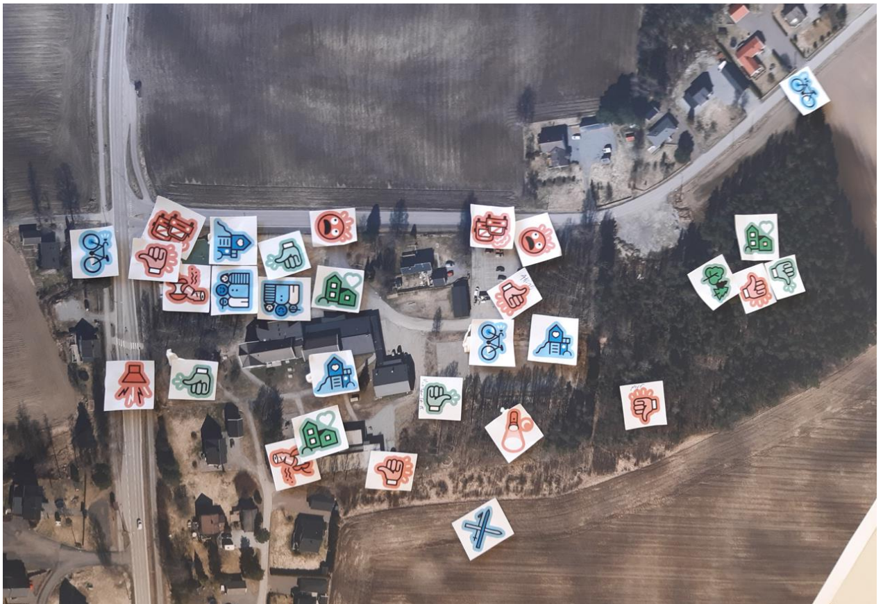
Figur 1: Oversiktskart etter arbeidsmøtet, der elevene har klistret på lapper.

Gjennom arbeidet fikk vi mange gode innspill, som hjelper oss til å identifisere områder med gode kvaliteter og noen klare utfordringer som må hensyntas gjennom arbeidet.